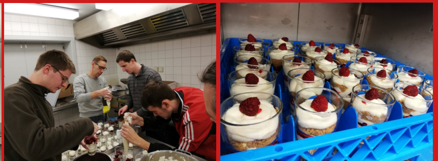
Fließbandarbeit beim Nachtisch & ein begeistertes Publikum