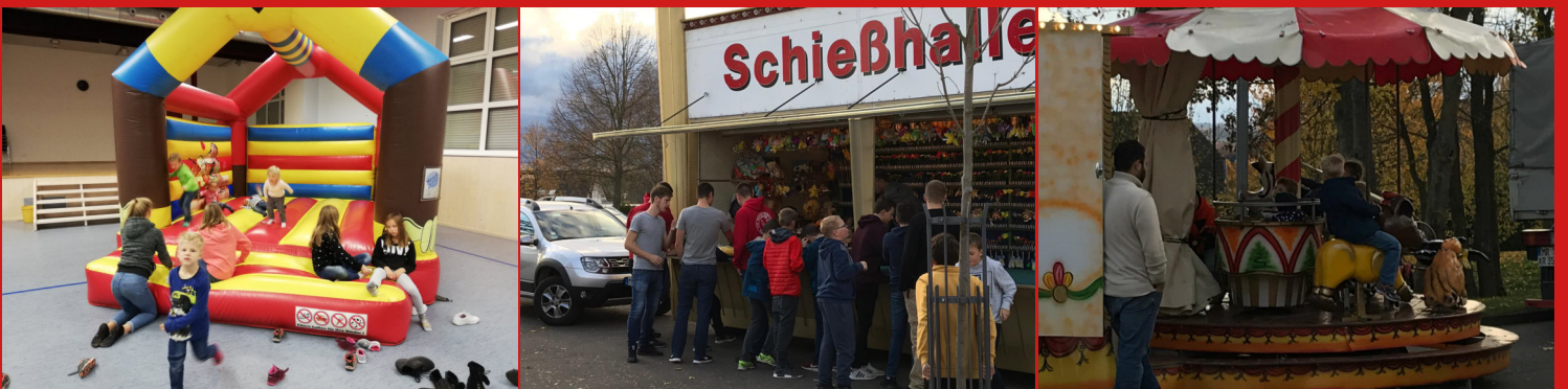
Viel los beim Hubertusfrühstück (oben) und an Hüpfburg, Schießbude und Karussell "Kappes un Erwes" Männer (rechts)