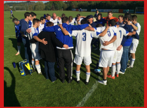
oben: 1. Mannschaft nach den beiden Siegen gegen Laudert unten: 2. Mannschaft nach dem Sieg in Burgen und Auderath nach hartem Kampf (erstmal eine rauchen)