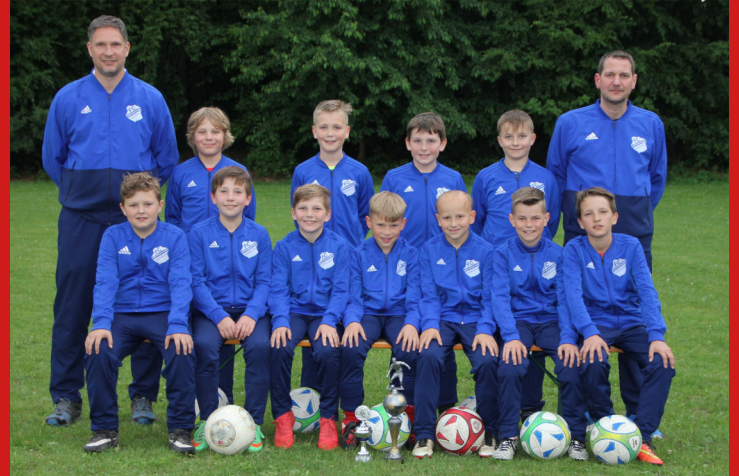
D2 oben und D3 rechts, unten D1