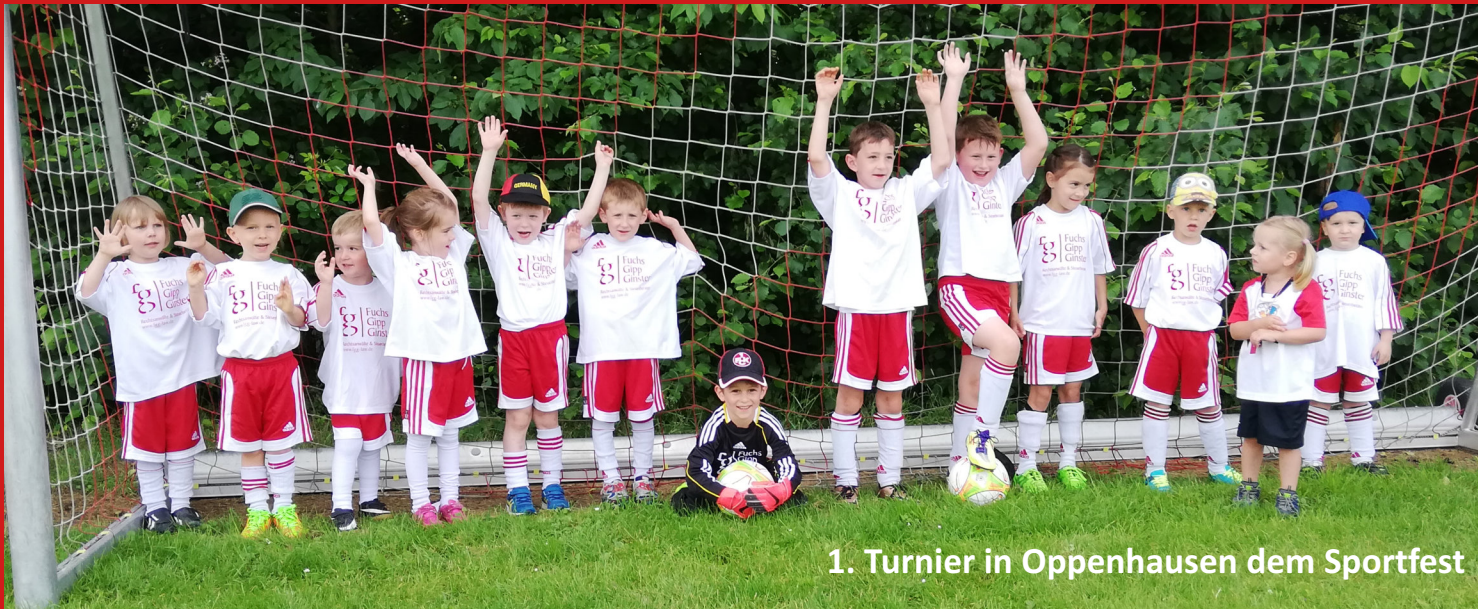
1. Turnier in Oppenhausen dem Sportfest

Training für alle Kinder ab 3 Jahren jeden Freitag ab 16:30 Uhr in der Niederkirchspielhalle oder auf dem Sportplatz Oppenhausen. Infos bei Sven Schneider: 06745/182155