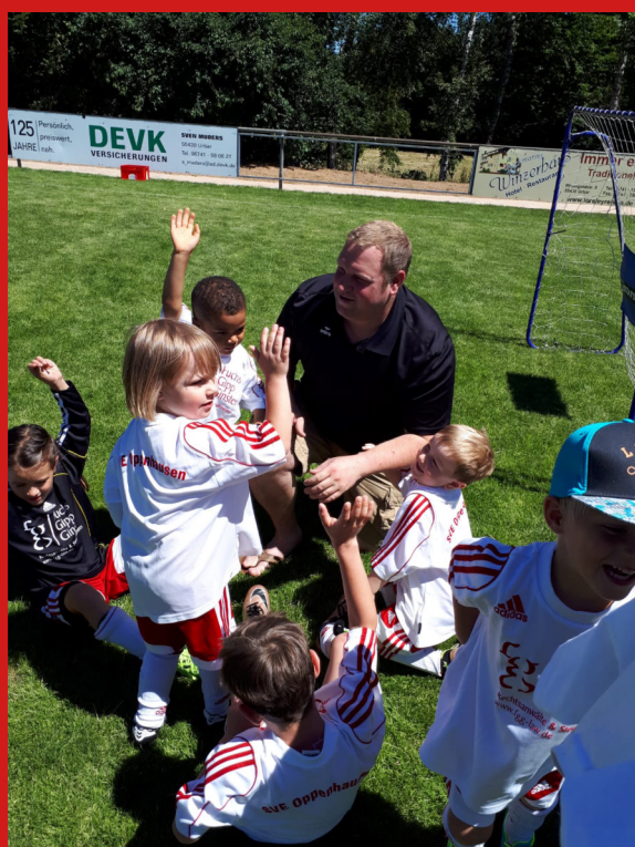
Turnier in Urbar