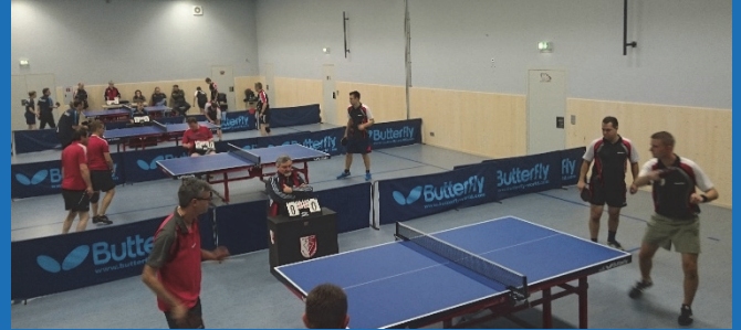
Volles Haus. SVE II gg. Rheinböllen, SVE III (hinten) gg. Buchholz = 2x Heimsieg und die Erste gewann auswärts in Zell.